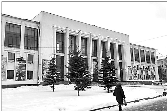
ДК Добрынина – по-народному «моторики».