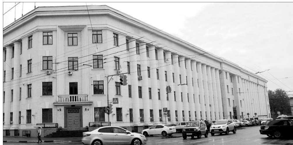
Здание УМВД в желтом цвете по-прежнему «серый дом».