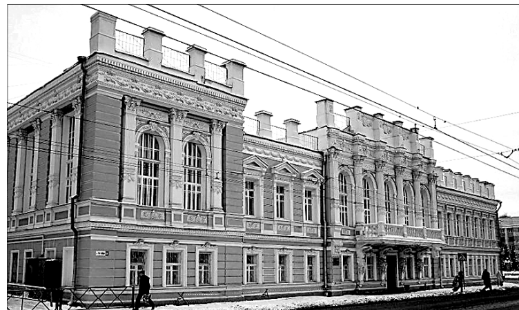
Здание на пр. Октября с «четырьмя непьющими».

Свои названия есть у жителей всех районов Ярославля. Кресты – конечная остановка троллейбуса № 9 на Московском проспекте. Местные называют так и всю близлежащую территорию – по имени стоящего здесь Крестобогородского храма. У брагинцев есть свои очки – пруд в парке 30-летия Победы назван так за свою форму. Заволжский Байкал название получил за чистую воду. А небольшой продуктовый магазин на Пятерке местные жители уже много лет называют «быки» за лепнину в форме бычьей головы над входом.