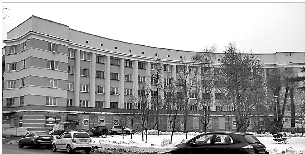
Дом-подкова на перекрестке пр. Октября и ул. Победы.

Свои названия есть у жителей всех районов Ярославля. Кресты – конечная остановка троллейбуса № 9 на Московском проспекте. Местные называют так и всю близлежащую территорию – по имени стоящего здесь Крестобогородского храма. У брагинцев есть свои очки – пруд в парке 30-летия Победы назван так за свою форму. Заволжский Байкал название получил за чистую воду. А небольшой продуктовый магазин на Пятерке местные жители уже много лет называют «быки» за лепнину в форме бычьей головы над входом.