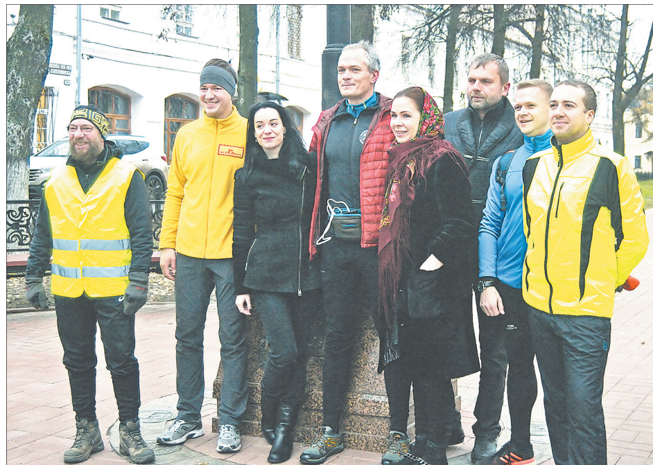
Фото на память.