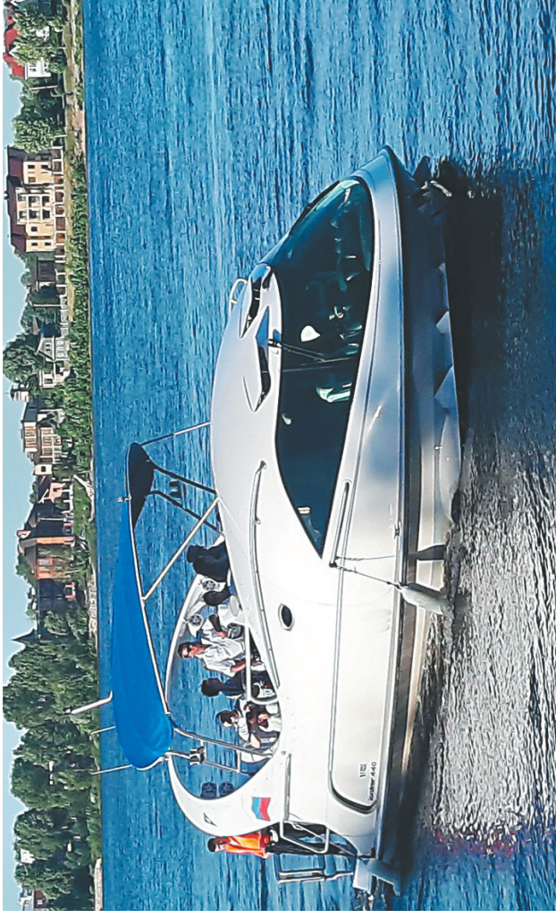
Яхта виртуальной реальности.