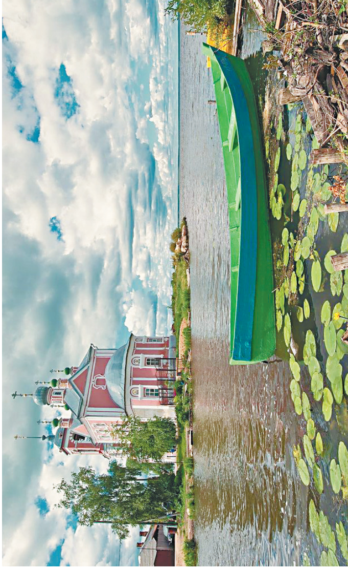
Национальный парк «Плещеево озеро».