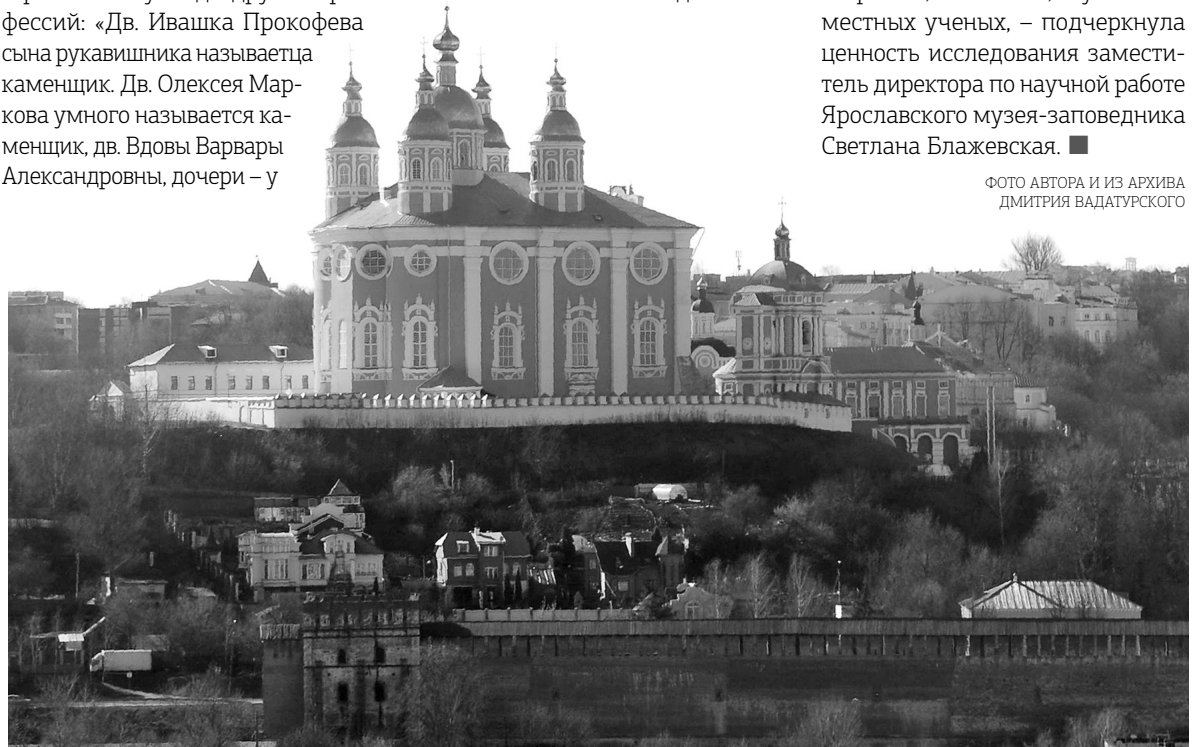
↓ В строительстве смоленского Свято-Успенского кафедрального собора принимали участие и ярославские каменщики.