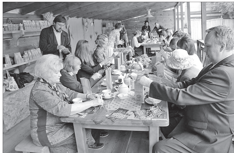
Мастер-класс по приготовлению чая.

Музей истории города Ярославля радуется новыми проектами к своему 20-летию. Нынешним летом для туристов подготовлены интерактивная программа «В гостях у купцов Кузнецовых», пешеходная экскурсия «Кузнецовские променады». Обновилась и выставка, посвященная семье бывшего хозяина дома купца 1-й гильдии Василия Кузнецова.