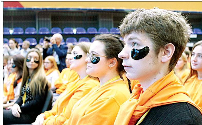
Слет собрал более 700 участников из 75 регионов России.

Более 700 участников из 75 регионов страны, 200 волонтеров, а также эксперты собрались в Ярославле на Первый слет Национальной лиги студенческих клубов. Он проходил в нашем городе с 22 по 26 октября сразу на нескольких площадках