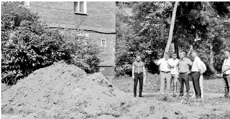
Благоустройство дворов на улицах Добрынина и Чкалова идет полным ходом.

В Ярославле продолжают работы по благоустройству дворовых территорий в рамках программы «Обустроим область к юбилею».