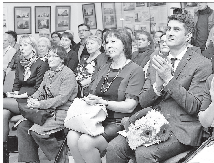
За 25 лет музей стал уникальной площадкой культурного взаимодействия представителей разных национальностей.

Уроженец Белорусской земли, выпускник Демидовского юридического лица Мак-