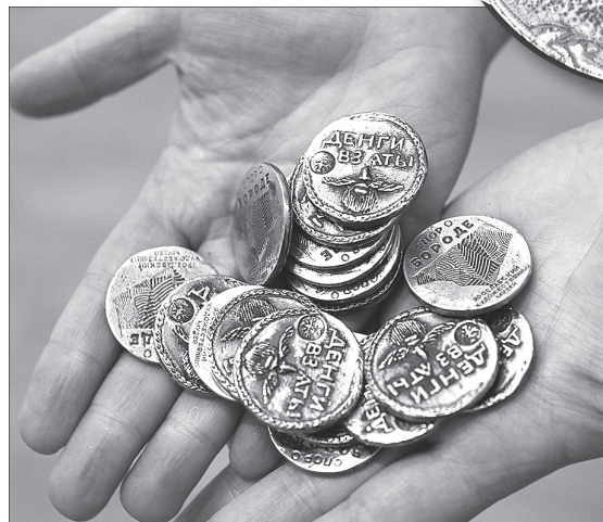
Бородовые знаки - сувениры.

От имени многих зрителей А.П. ЛЕБЕДЕВА