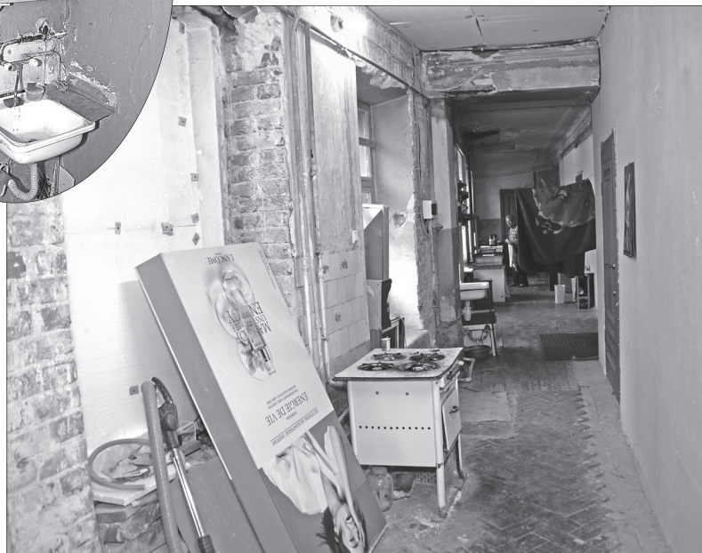
Вот так выглядит дом изнутри...