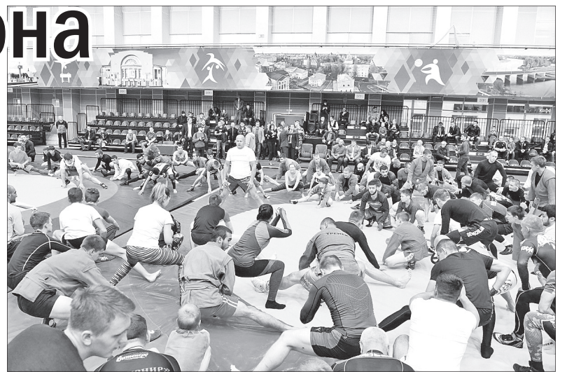
Занятие продолжалось около полутора часов.

– Ярославская земля особенная. Здесь столько святынь, что хочется возвращаться сюда снова и снова. И здесь отличные борцы – с горящими глазами, огромным желанием побеж-