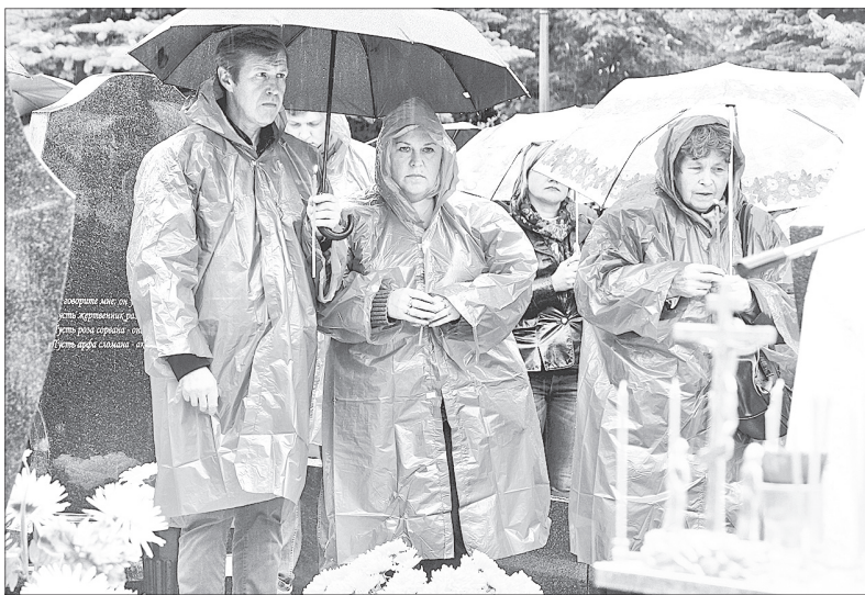
Дождь слезами течет по лицам.