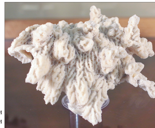
Шестилучевой коралл. Атлантический океан.

Всего в витринах выставки разместились 180 образцов минералов, поделочных камней. Среди них есть распространенные: кальцит и яшма, агаты и