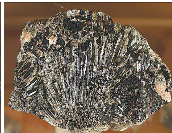
Турмалин. Россия, Урал.