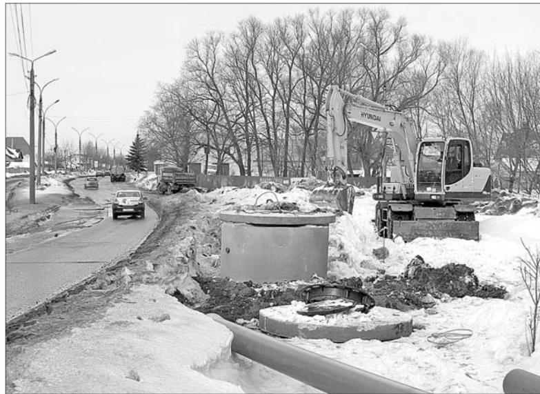
До начала основных дорожных работ — ремонт сетей.

В 2018 году продолжается работа по реализации приоритетного проекта «Безопасные и качественные дороги России». В рамках подготовки к ремонту дорог на улице Магистральной начались работы по реконструкции водопровода.