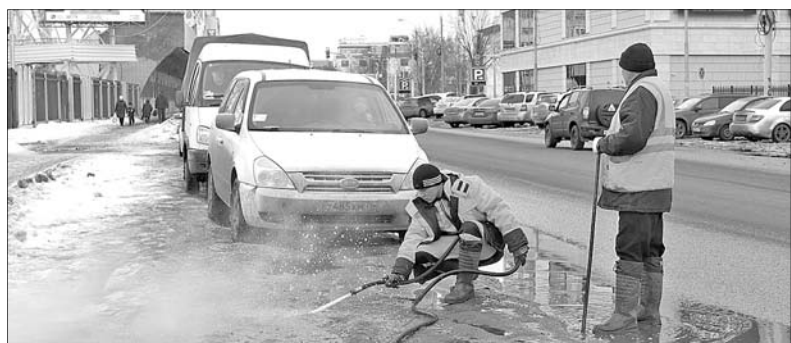
Идут работы по расчистке колодцев.