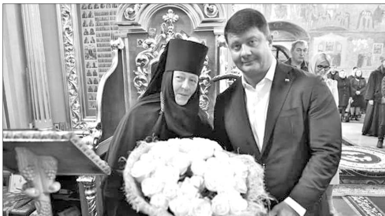
Владимир Слепцов поздравил игуменью Варвару.

Вчера, 25 сентября, в последний день многодневного праздника Рождества Пресвятой Богородицы, митрополит Ярославский и Ростовский Пантелеимон провел богослужение в Свято-Введенском Толгском женском монастыре.