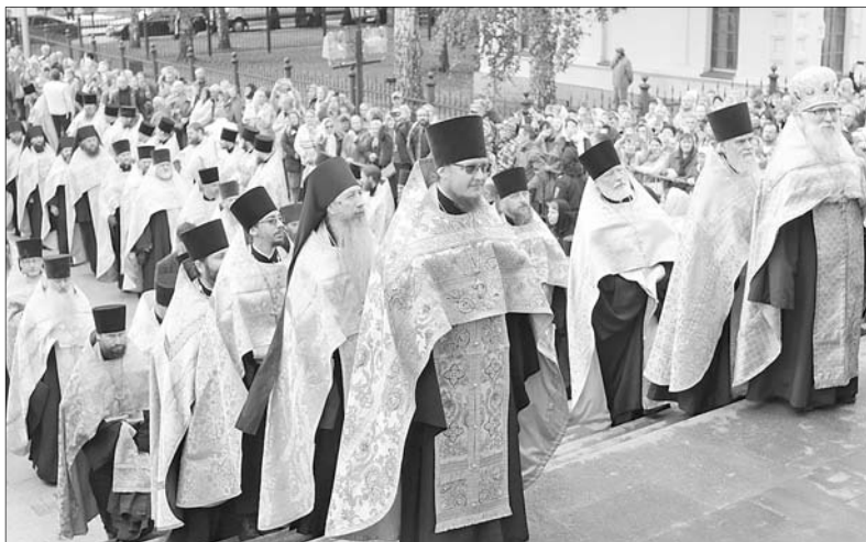
В Успенском соборе.