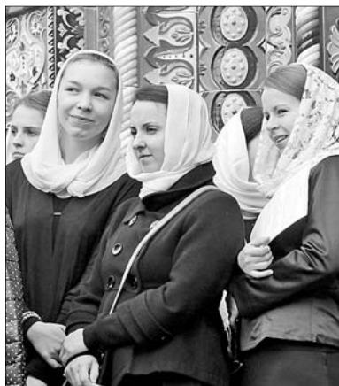
У входа в храм.

— У нас появилась возможность в этом году привезти святыню сразу в несколько российских городов, — отметил представитель фонда Геннадий Дюмин. — И везде люди стоят в очереди к мощам день и ночь. В сутки святыне поклоняются примерно от 15 до 20 тысяч человек.