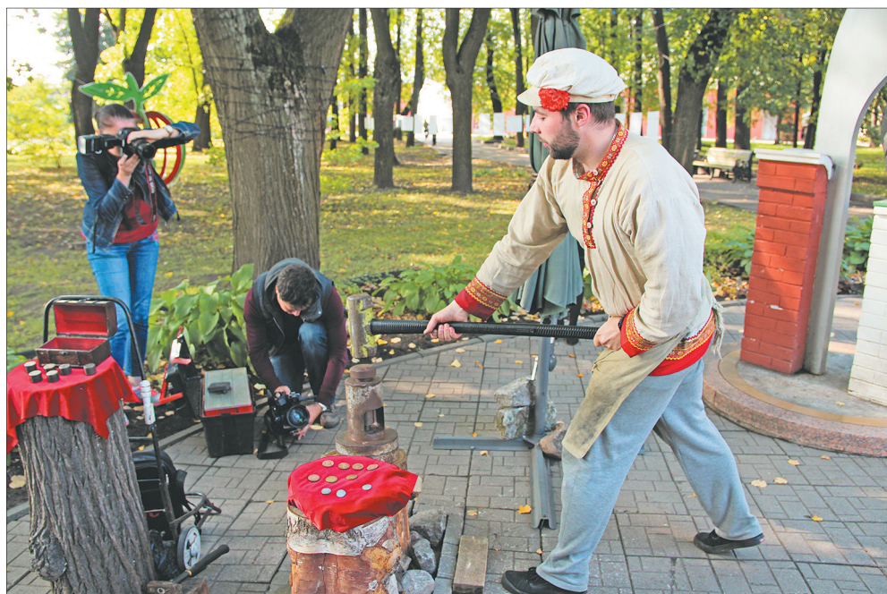
Так чеканили копейки в 1612 году.

Храм, изображенный на 1000-рублевой купюре, — церковь Иоанна Предтечи, известная уникальными фресками. На них — полторы тысячи библейских сюжетов, больше, чем в каком-либо другом храме. Летом туристы смогут побывать внутри церкви и насладиться фресками.