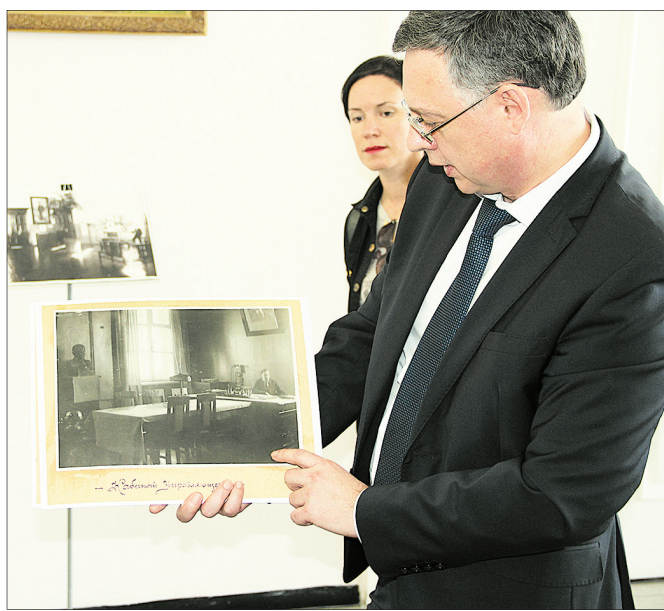
На экскурсии по банку.

Храм, изображенный на 1000-рублевой купюре, — церковь Иоанна Предтечи, известная уникальными фресками. На них — полторы тысячи библейских сюжетов, больше, чем в каком-либо другом храме. Летом туристы смогут побывать внутри церкви и насладиться фресками.