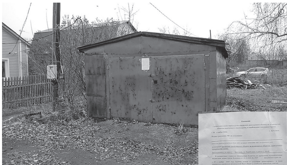
Работник территориальной администрации Красноперекопского и Фрунзенского районов мэрии города Ярославля

Извещение получено _____ (Ф.И.О., должность, подпись гражданина или уполномоченного представителя юридического лица, самовольно установившего объект)