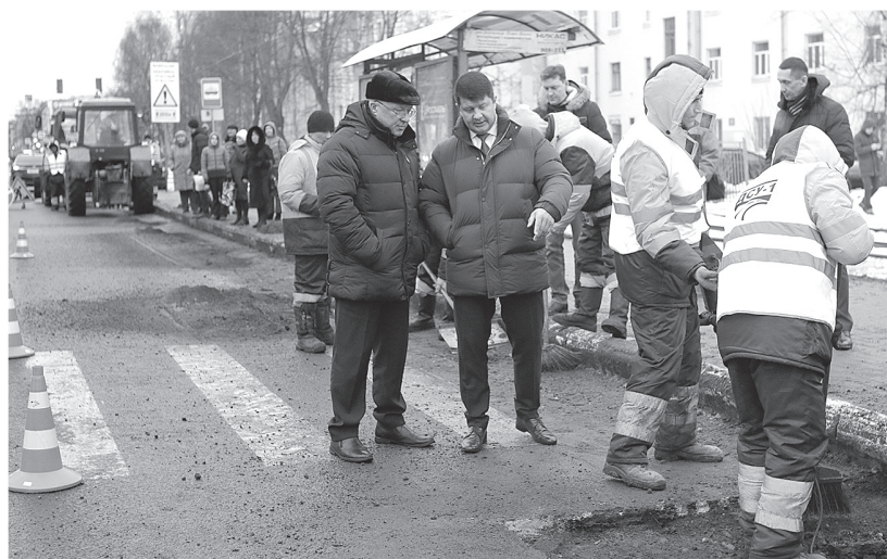
Мэр Ярославля контролирует ход работ.

В новом году в Ярославле продолжился ямочный ремонт дорог. В разных районах города уже отремонтировано около тысячи квадратных метров дорожного полотна. Только за неделю, с 3 по 11 января, ликвидировано 426 ям.