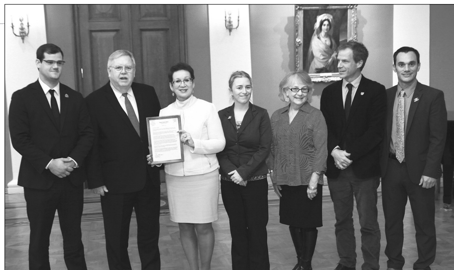
На открытии фестиваля «Мост через океан».

Ребята из Голландии побывали в Детском морском центре им. Федора Ушакова и музее-усадьбе «Карабиха», посетили школьные уроки.