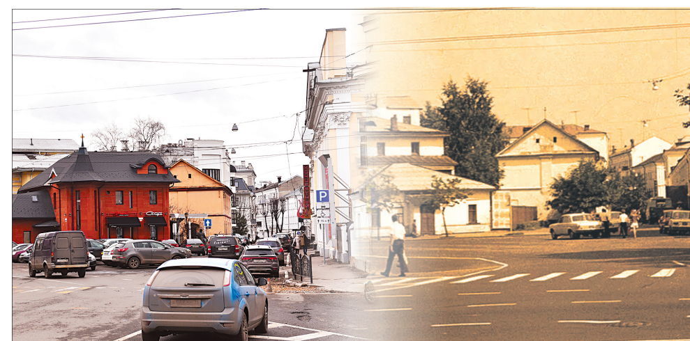
Вид на улицу Максимова с площади Волкова сегодня и в 1977 году.

С конца XVIII века нынешняя улица Максимова называлась Всехсвятской по располагавшейся на ней церкви Всех Святых. В 1918 году улицу переименовали в Комитетскую. Дело в том, что на этой улице в здании бывшей аптеки Фишера располагалась конспиративная квартира Ярославского комитета РСДРП. В августе 1984 года улицу снова переименовали, на этот раз в честь А.Е. Максимова, генерал-майора авиации, прожившего свои последние годы в Ярославле.