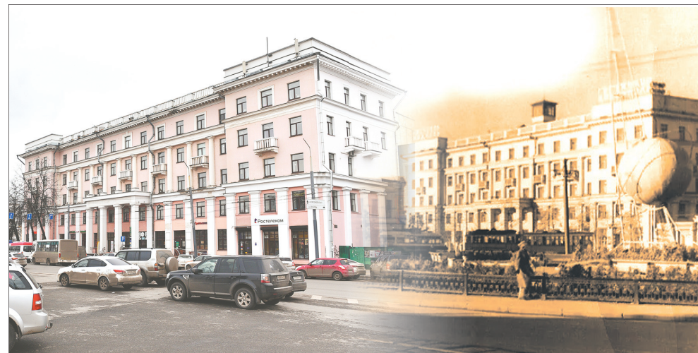
Здание с гостиницей «Ярославль» в центре города сегодня и в 1960-е годы.