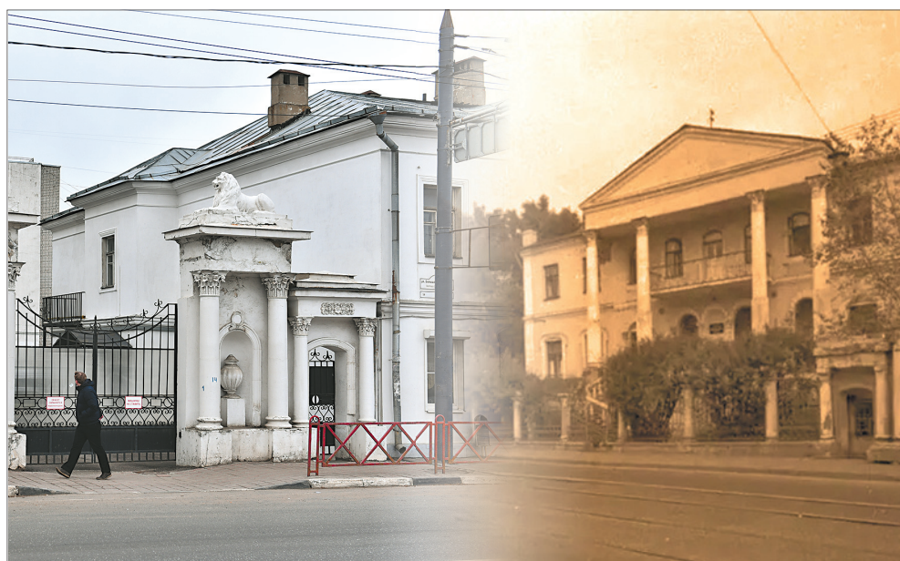
Городская усадьба Сорокина на улице Большой Октябрьской сегодня и в 1981 году.

Городская усадьба купца и фабриканта Сергея Сорокина более известна ярославцам как дом со львами. Усадьба была построена на средства купцов Затрапезновых еще до утверждения регулярной планировки города в середине XVIII века. В 1760 году в Ярославле было всего 46 каменных домов, и этот дом, как отмечается в старых путеводителях, считался лучшим из предназначенных для приема знатных гостей. Здесь когда-то была временная резиденция первого генерал-губернатора Ярославского наместничества А.П. Мельгунова. То здание не сохранилось в первоначальном виде. В 30-е годы XIX века его перестроил новый владелец С.Н. Сорокин.