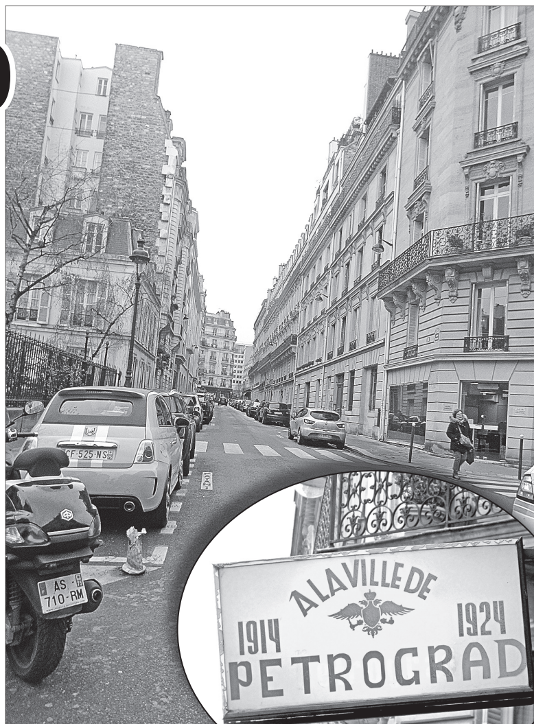
Улица Дарю в Париже.