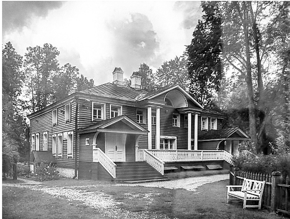
↓ Дом Островского в Щельково.

Следующую остановку путники сделали в Ростове. «Город из уездных, какие я до сих пор видел, самый лучший», – похвалил Ростов Островский, удивленный особенным изяществом множества церквей. Еще одну остановку сделали на постоялом дворе старинного села Шопша. Оттуда до Ярославля оставалось всего несколько часов пути.