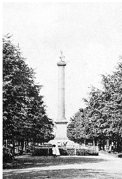
↓ Демидовский столп.