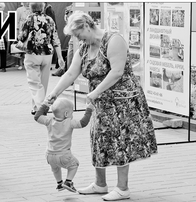
Внуки — вот главная радость для бабушки.

Не обойдены бывшие труженики моторного завода и «пищей духовной». Раз в месяц пенсионеров приглашают на концерт в ДК им. Добрынина и на тематические вечера в библиотеку. Во Дворце культуры собирается обычно 400 — 500 человек.