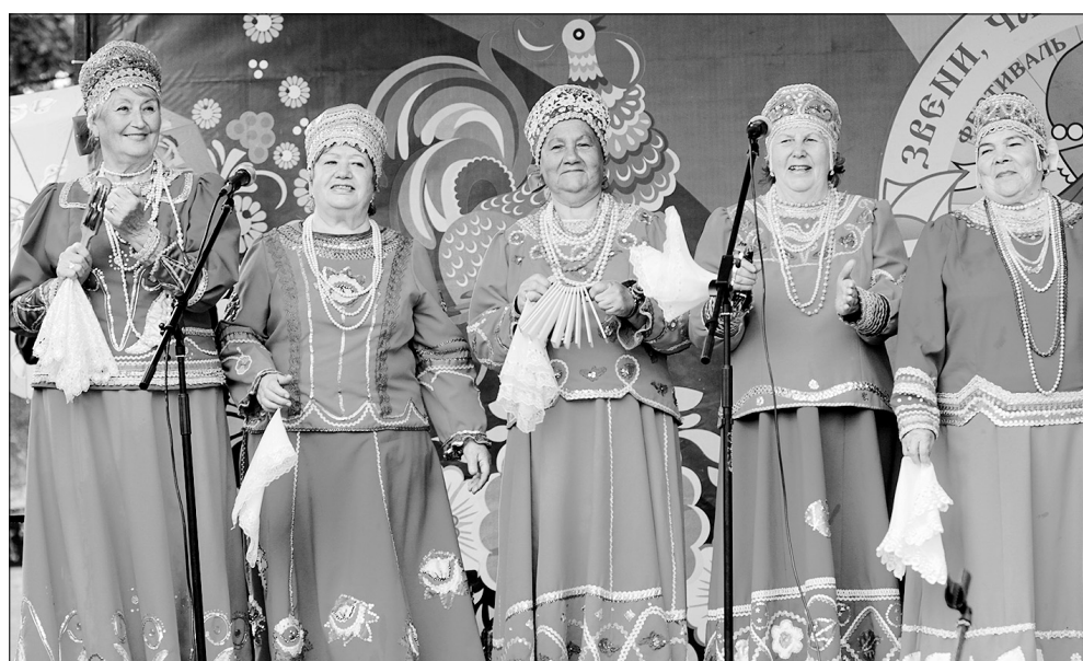
И в золотом возрасте можно найти увлечение по душе.

Работа городского и районных советов строится на общественных началах, на чистом энтузиазме. Взносы, на которые ветеранские организации могли бы существовать, тоже не взимаются. По мере сил помогают городские власти — на поддержку выделяется около 550 тысяч ру-