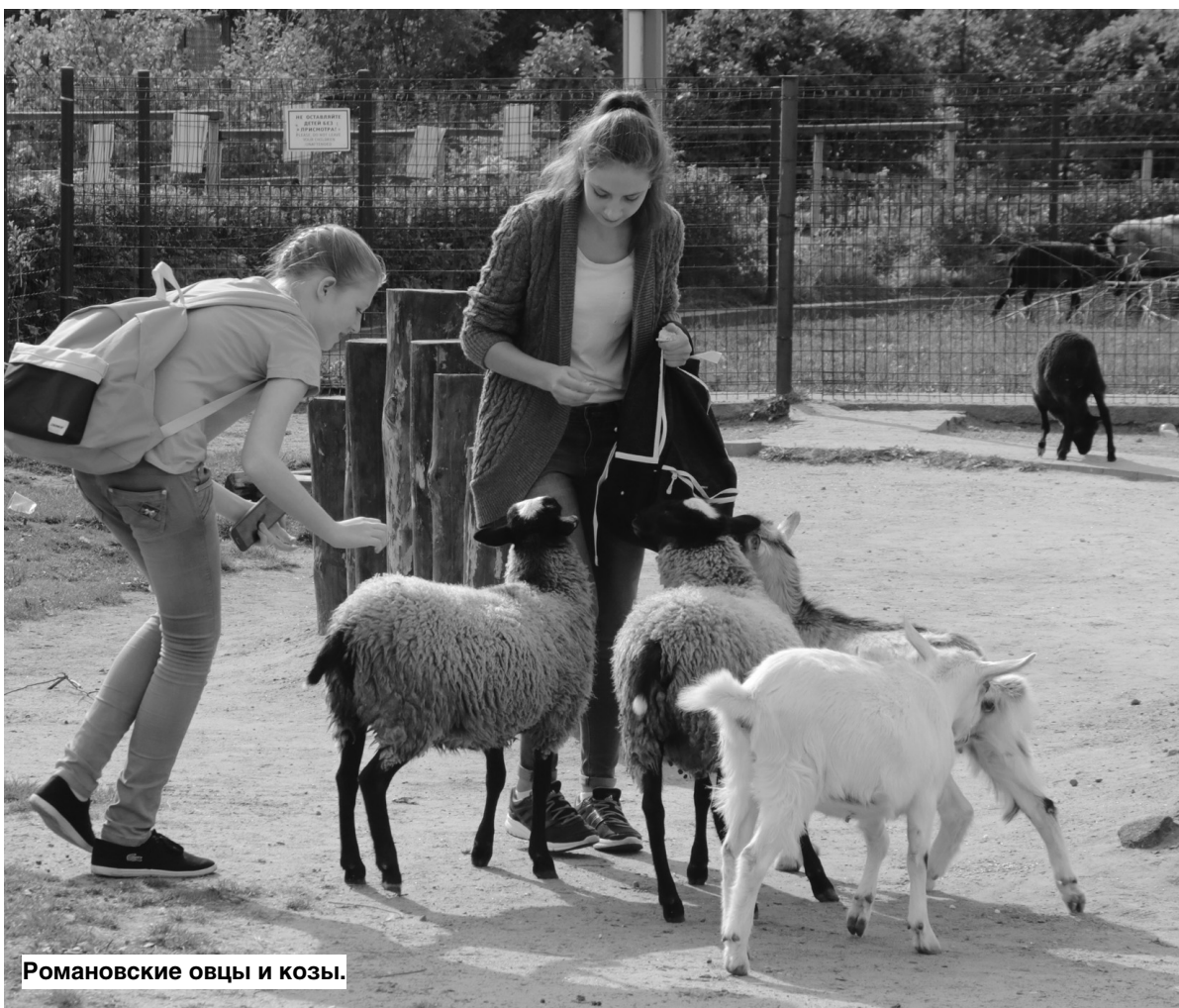
Романовские овцы и козы.

Кстати, цена на животных зависит от многих факторов — родословной, здоровья, возраста, внешнего вида. В прошлом году, например, у косуль была одна стоимость, а нынче они оказались востребованы и стоимость грациозных животных выросла. Причем цены на них существенно отличаются.