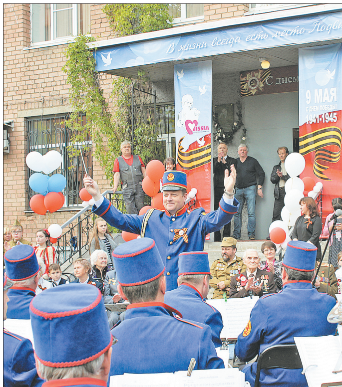
И зазвучал оркестр...