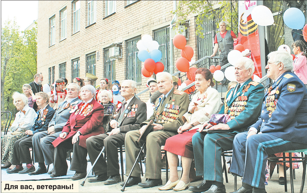
Для вас, ветераны!