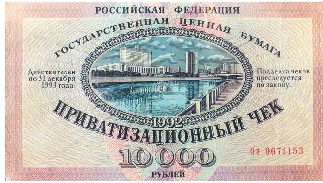
Приватизационный чек (ваучер).