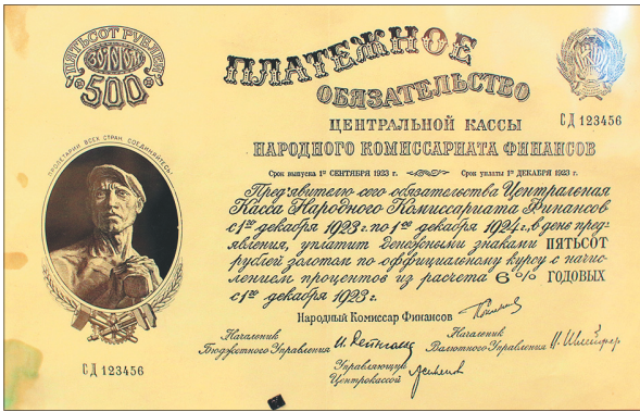
Банкноты периода Гражданской войны.