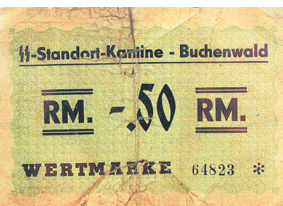
Денежный знак концлагеря Бухенвальд.

Лагерная валюта имела место и в системе ГУЛАГ. Расчетные квитанции номиналом 1,3, 5, 10 рублей появились в обращении среди коллекционеров в период перестройки, когда рассекретили архивы. Подобными денежными средствами с 1928 по 1934 год руководство вы-