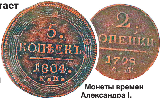
Монеты времен Александра I.