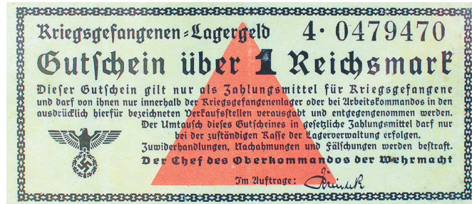
Деньги для лагерей военнопленных под управлением Вермахта.