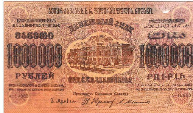
Миллион рублей. И это не предел.