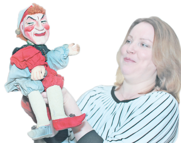
Вот такой Петрушка.

— В нем нет поролона, который быстро сгнивает, — отметила худож-