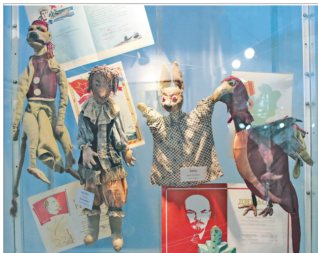
В музее театра.

Ярославскому театру кукол 1 марта исполнился 91 год. Накануне дня рождения в театр вернулся старейший актер, практически ровесник самого театра – кукла Петрушка.