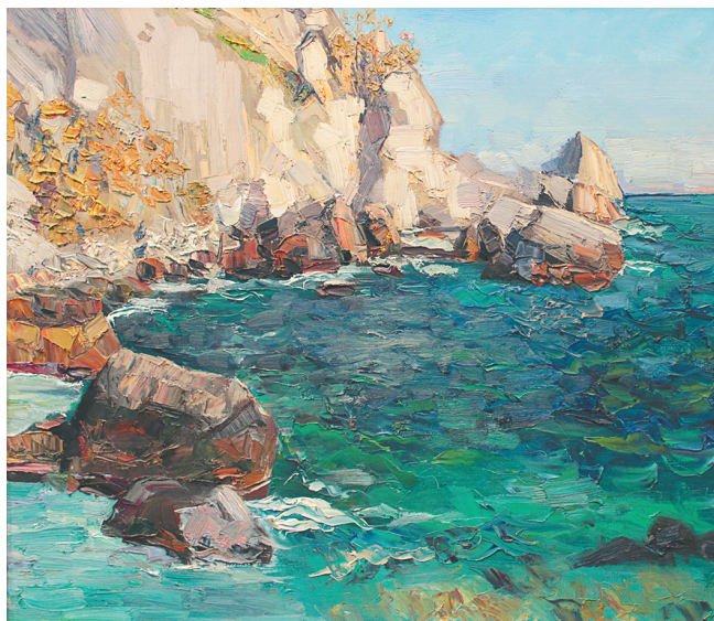
«В бухте Чехова».

— Моя супруга Мария подсчитала, что я провел 200 пленэров от одного до трех дней и 30 больших пленэров, среди которых академические, межреги-