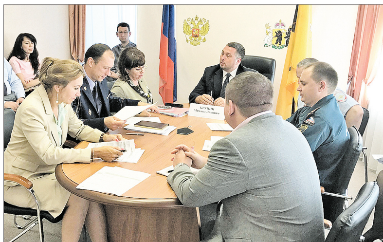
На Всероссийском селекторном совещании в правительстве области.

Всероссийское селекторное совещание по итогам первой смены летней оздоровительной кампании 2017 года открыла уполномоченный при Президенте РФ по правам ребенка Анна Кузнецова.