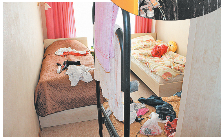
Вот так выглядят комнаты, где живут ребята.

ленной сотрудниками лагеря, в конце июля на территории отдыхали 426 детей. С целью проверки порядка размещения детей в комнатах были запрошены акты размещения, утвержденные Роспотребнадзором, однако их у представителей лагеря не оказалось. В связи с этим в адрес руководителя санатория-профилактория уполномоченным было направлено заключение об устранении нарушений. В установленный срок оно выполнено не было. Материалы проверки направлены в областную прокуратуру для принятия мер реагирования.