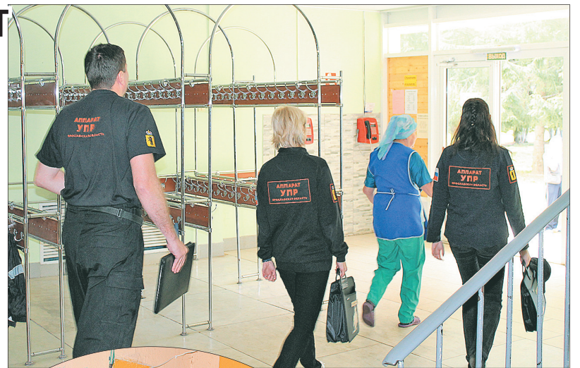
В ходе проверки были осмотрены пищеблок, здание медицинского изолятора.

В ходе проверки были осмотрены жилые корпуса, пищеблок, здание медицинского изолятора. По информации, предостав-