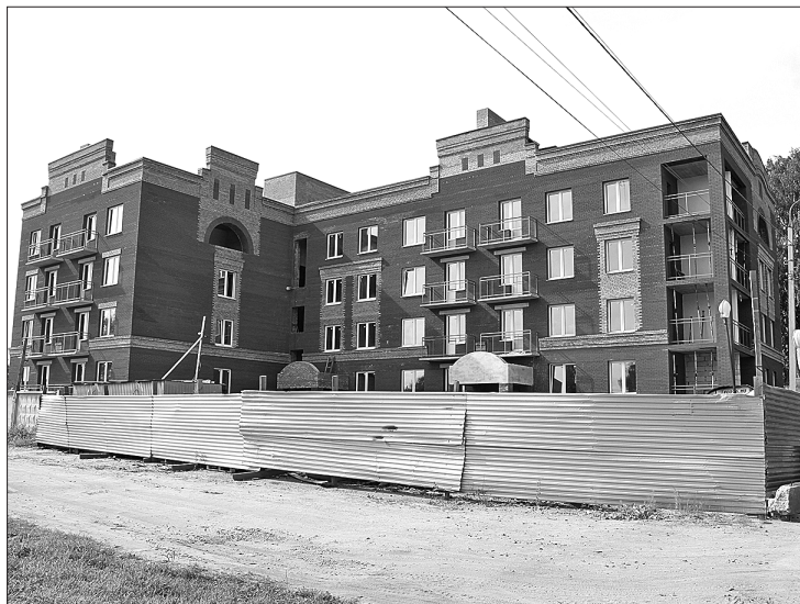
Дом № 82 на улице Маяковского почти готов.

На строительстве очередного жилого комплекса на улице Кавказской застройщику было указано на необходимость внести коррективы в благоустройство территории. Строителям нужно обустроить дополнительные парковочные места. Еще одно замечание касалось контейнерной площадки. Кроме того, согласно постановлению мэрии все детские и спортивные площадки во дворах должны быть оснащены мягким ре-