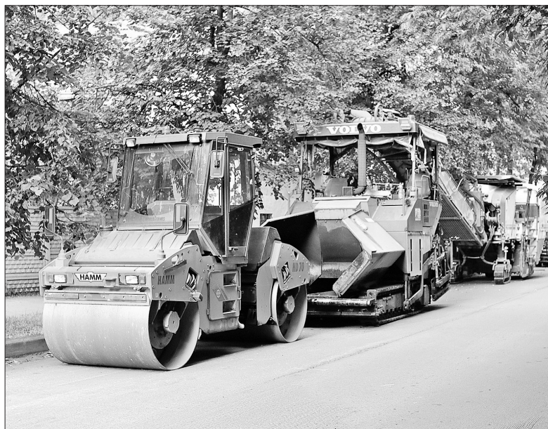
Техника на улице Свердлова.

Подходит к завершающему этапу ремонт ярославских дорог. Ежедневно во всех районах города работают четыре подрядные организации. В Кировском, Ленинском и Дзержинском районах – ООО «Дорожное управление» из Вологды. Проезжую часть улиц Фрунзенского и Краснопереконского районов ремонтируют москвичи – компания «Экоград». В Заволжском районе работы ведет Угличское дорожно-строительное управление. Ямочным ремонтом дорожного полотна во всем городе занимается компания «Северный поток».