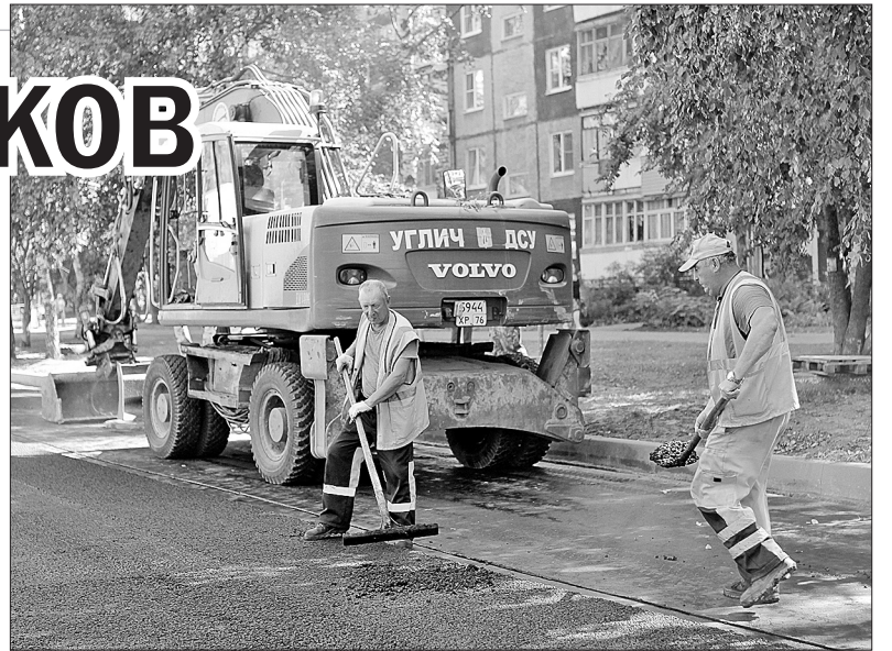
Укладка асфальта ЩМА на улице Орджоникидзе.

ны светофорные объекты, благоустроены пешеходные переходы. На свежеложенном асфальтовом покрытии появится новая дорожная разметка.