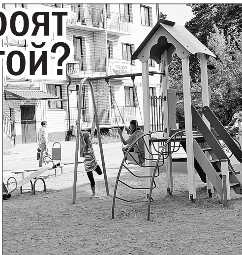
Детская площадка на улице Кавказской.

Продолжается проверка стройплощадок города. В минувшую пятницу комиссия побывала в Заволжском районе.