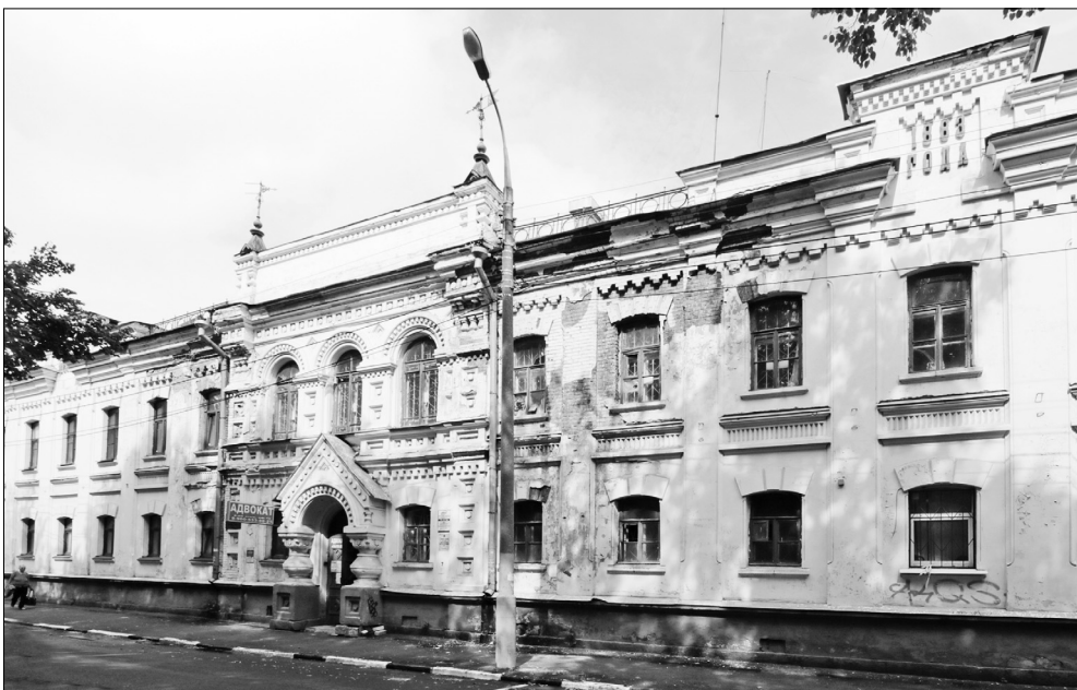
Здание бывшей богадельни Вахромеева на Красном съезде. Современный вид.

*Сроки проведения акции по 30 июня 2016 года. Имеются ограничения, подробности об организаторе акции, правилах ее проведения уточняйте по тел. 8 (4852) 21-07-75.