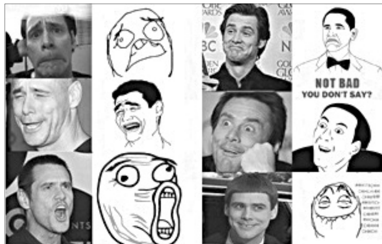
Гримасы Джима Керри в виде мемов.