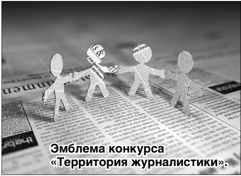
Эмблема конкурса «Территория журналистики».