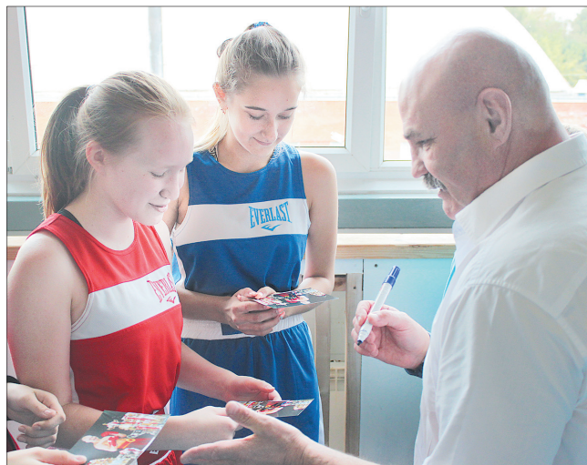
Девчонкам на память от олимпийского чемпиона.

В России, по словам Вячеслава Яновского, немало отошли от канонів, погнались за быстрым ре-