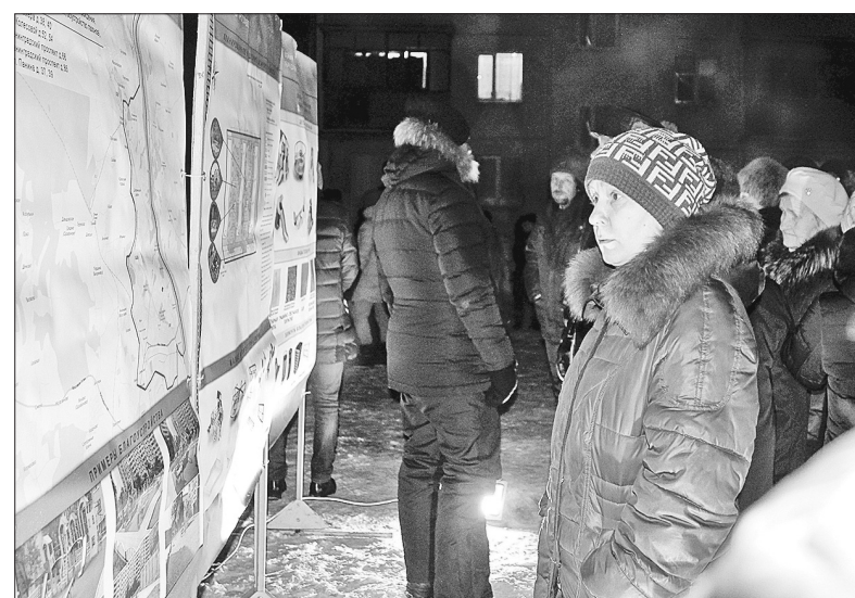
С проектом благоустройства дворов могли ознакомиться все.