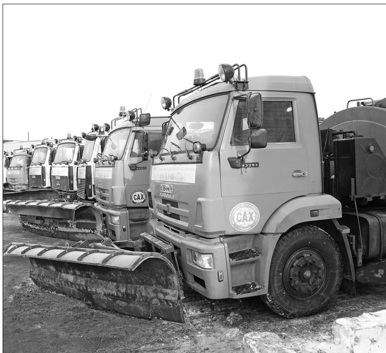
Техника в полной готовности.

В минувшую пятницу в Ярославле на площадке МУП «САХ» прошел смотр техники.