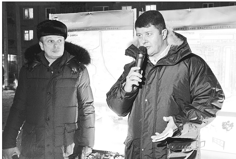
На встрече с жителями.