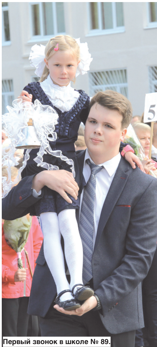
Первый звонок в школе № 89.

1 сентября в ярославских школах, как и по всей стране, вновь прозвенел звонок, созывая учеников. Этот день, а нынче он выдался на редкость солнечным и теплым, всегда особенный в школьной жизни: отдохнувшие за лето ребята встречаются с друзьями, педагогами, обмениваются впечатлениями, радуются, что увиделись вновь после летних каникул.