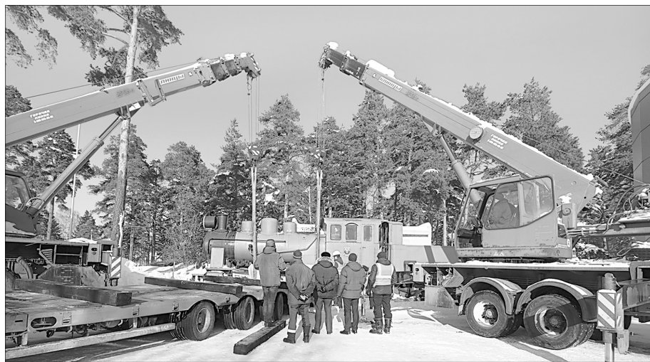
В демонтаже задействовали два крана.

ит с 1986 года. Его помнит не одно поколение ярославцев. Локомотив будет отреставрирован в депо Санкт-Петербург-Финляндский.