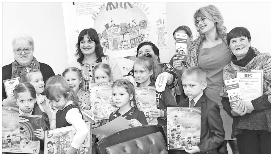
Победители и призеры конкурса получили подарки.

Итоги конкурса плакатов на тему работы жилищно-коммунального хозяйства подвели 27 февраля в Ярославле. Дети в рисунках и аппликациях призывают экономить воду и электроэнергию, беречь природу, собирая мусор отдельно, а также вовремя оплачивать услуги ЖКХ.