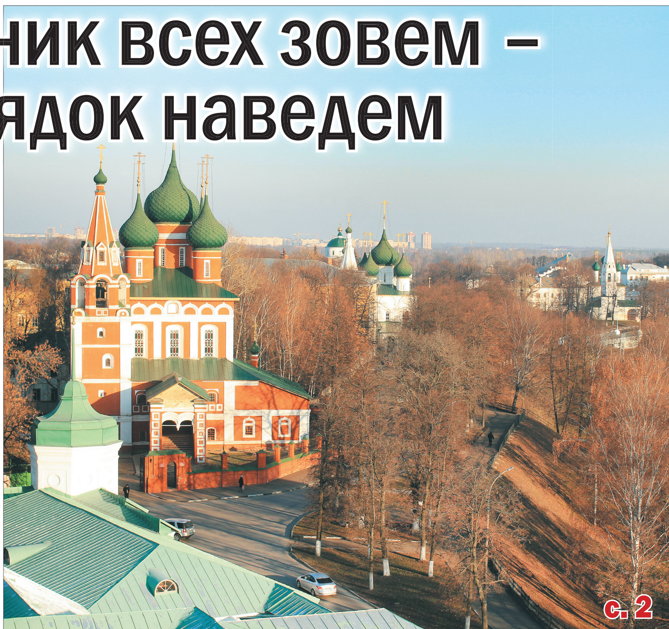
Весна – время обновления.

А газета «Городские новости» объявляет конкурс частушек и веселых фотографий на тему «Сделаем город чистым». Обещаем лучшие фото и короткие частушки опубликовать. Можно эти два задания объединить в одно – прислать фото, а частушку как подпись к снимку. Письма присылайте по почте или на электронный адрес news@city-news.ru Тема письма «Сделаем город чистым».