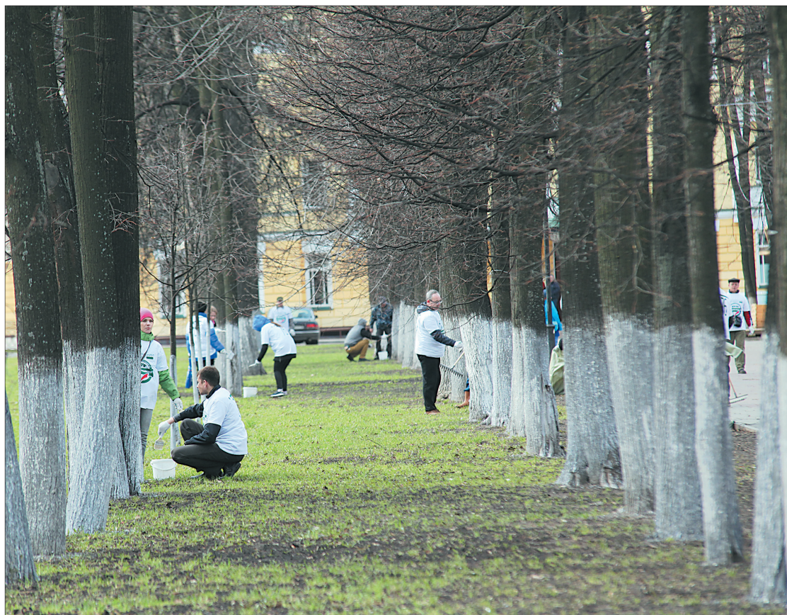
На Первомайском бульваре работы проходят каждый год.