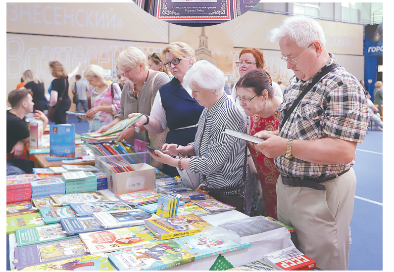
↓ Книжная ярмарка.

собрала самые интересные и эффективные мои методики, вплетаю их в канву сказки.