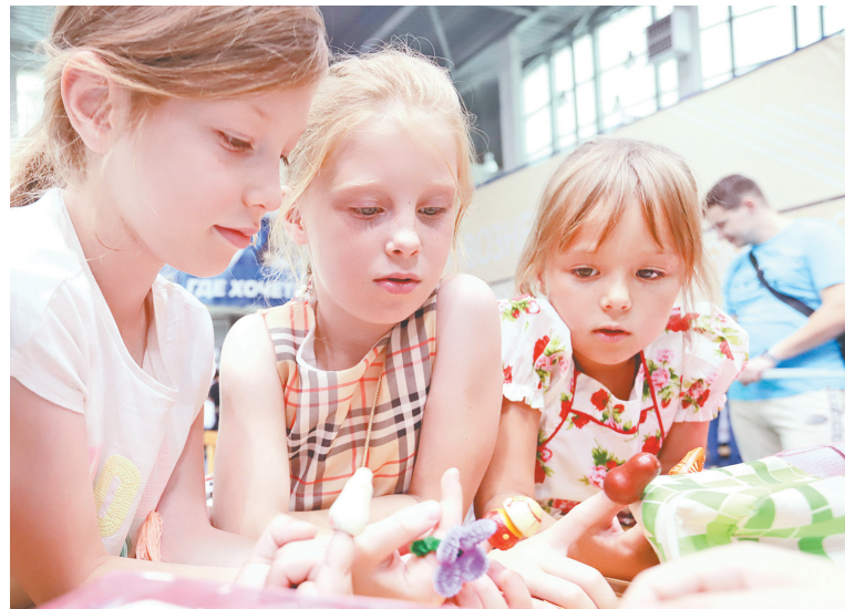
↓ Мастер-класс на английском языке.