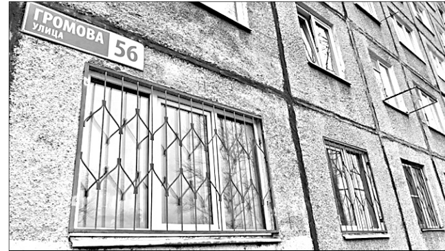
Подготовила Екатерина ЛАСТОЧКИНА

К восстановительным работам планируется приступить в ближайшее время.