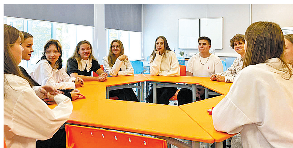
↓ Коворкинг в школе № 31 – здесь хочется творить.