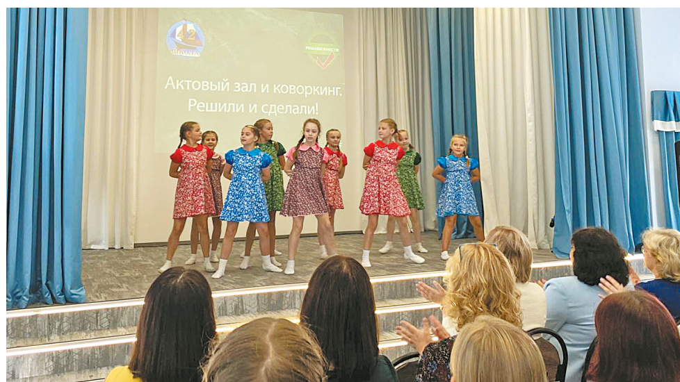
↓ Актовый зал в школе № 42 создан таким, каким его увидели дети.