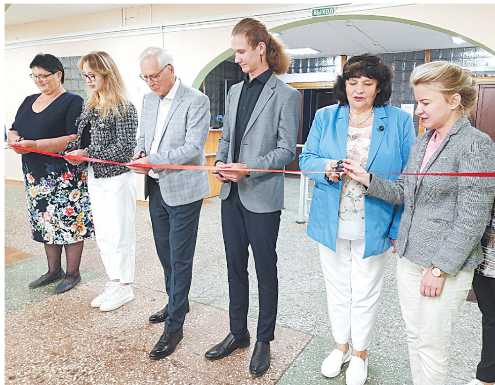
↓ Проекты открывали торжественно.

К началу наступившего учебного года в трех ярославских школах завершили работы по реализации проектов «Школьного инициативного бюджетирования». Обновленные интерьеры встречали учеников 31-й, 42-й и 87-й школ.