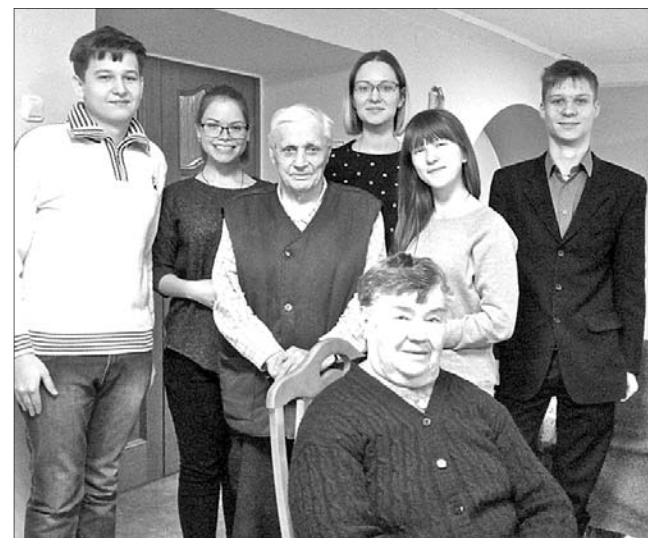
Старшеклассники школы № 26 с Н.В. Паниным.

«Как ветеран войны в одиночестве остался», № 45 от 14 июня 2017 года.