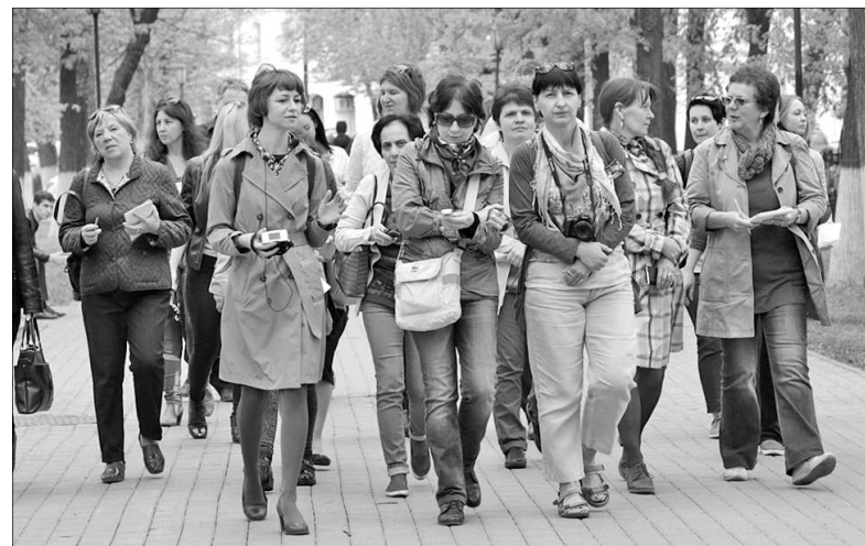
На экскурсии «Купеческий Ярославль».