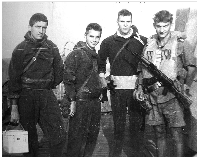
С боевыми друзьями.

под водой. За это время морские спецназовцы должны были найти и обезвредить подводных диверсантов.