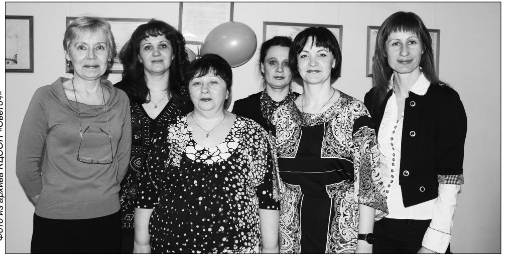
Сотрудники КЦСОН «Светоч».

В эту профессию люди приходят по-разному, но остаются те, кто не ошибается в выборе. Благодаря стараниям соцработников утихает боль, они, как добрые волшебники, хранят тайны своих подопечных, они помощники тем, кто не в силах сделать даже шаг, взять в руки ложку, улыбнуться без боли, увидеть мир своими глазами... Благодаря их заботе люди возвращаются к жизни. В нашем учреждении таких сотрудников – 221 человек.