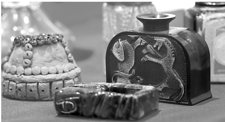
↓ Чернильницы для перьевых ручек.

В Международный день почерка, который ежегодно отмечают зимой, в Музее истории города Ярославля прошел мастер-класс по чистописанию.