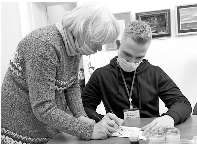
↓ Мастер-класс по каллиграфии.