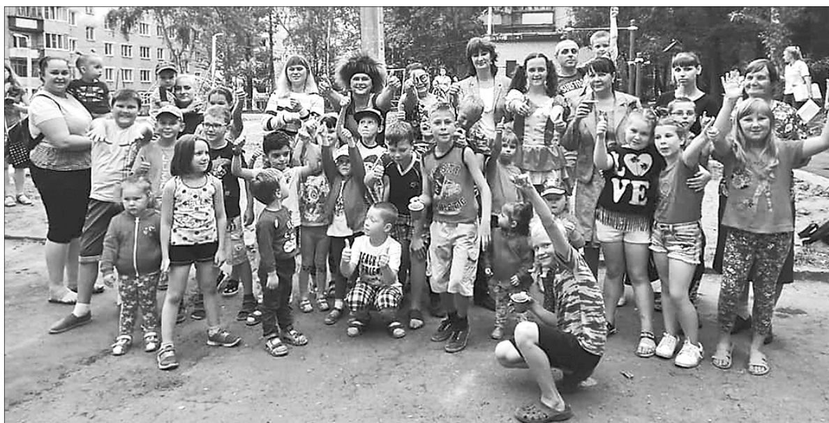
Праздник удался на славу.