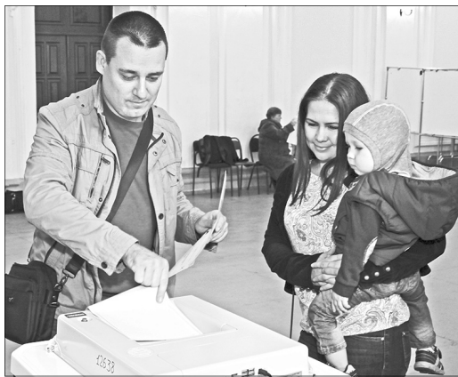
9 сентября, как и на предыдущих выборах, участки будут оборудованы КОИБаами.

Нынешняя предвыборная кампания отличается обилием судебных тяжб. В итоге споров и разбирательств три партии все же ушли с выборов. «Яблоко», «Родная партия» и партия «РОСТА» уже достаточно давно вышли из политической борьбы. Партию «Парнас» областной суд снял с предвы-