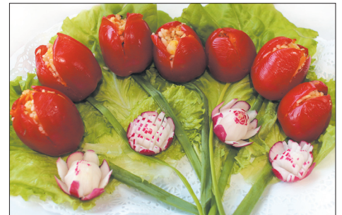
Тюльпаны из помидоров.