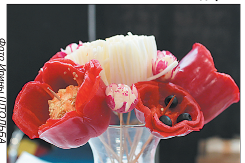
Как настоящие маки.