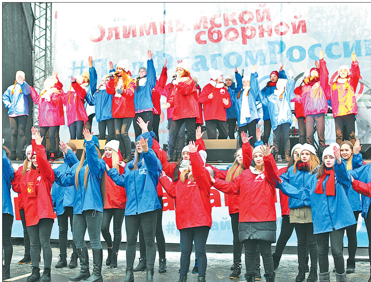
Акция в поддержку олимпийцев началась с флешмоба.

В минувшую субботу, 3 февраля, на Советской площади прошел масштабный праздник в поддержку российских спортсменов на предстоящей Олимпиаде в Пхенчхане.