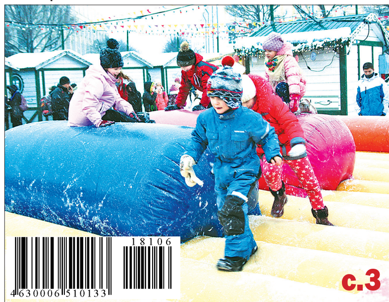
Батут – любимое развлечение малышей.