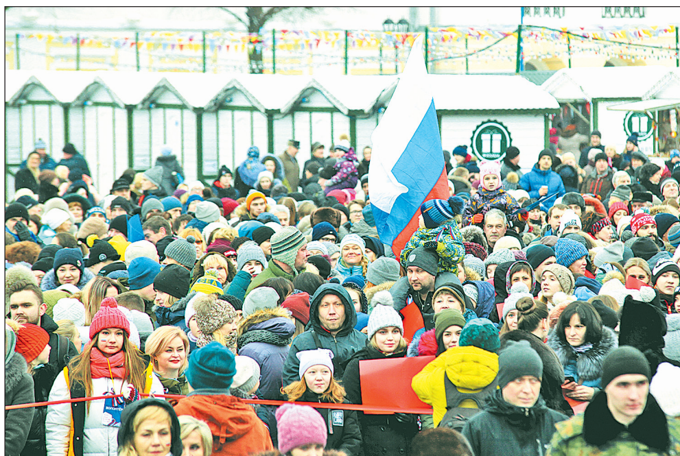
Поддержать российских олимпийцев пришли тысячи ярославцев.