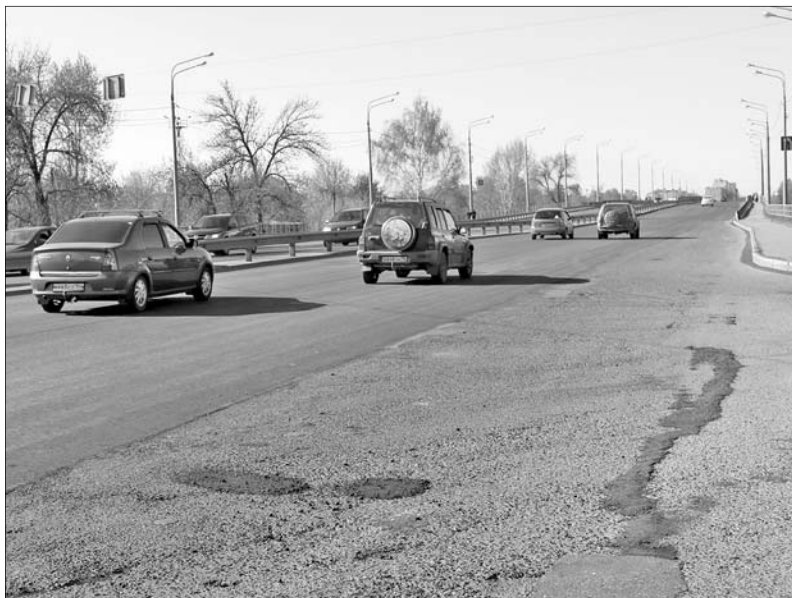
Ямочный ремонт на Толбухинском мосту.

Ремонт большими картами уже сделан на площади 3400 ква-