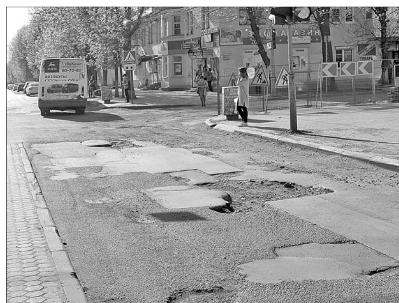
Улица Чкалова в ожидании ремонта.