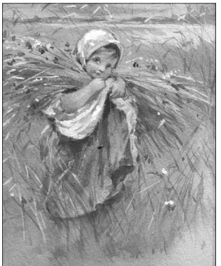
Девочка с колосьями.