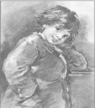
Пожелание «Эх ма, кабы да нам денег тьма...».