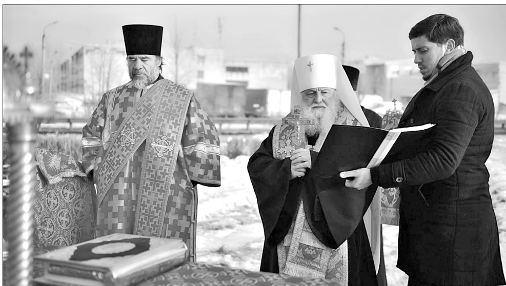
Чин освящения поклонного креста на улице Громова совершил митрополит Ярославский и Ростовский Пантелеимон.

Анна СВЕТЛОВА