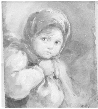
Девочка с узелком. 1902 г.

В художественном музее открылась предновогодняя выставка рисунков