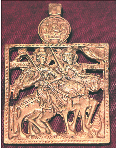
Икона «Святые князя Борис и Глеб» по иконографии XV века.