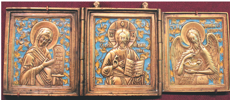
Складень трехстворчатый «Деисус». Конец XVIII века. Поморье.