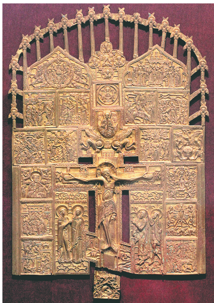
Большое патриаршее распятие.