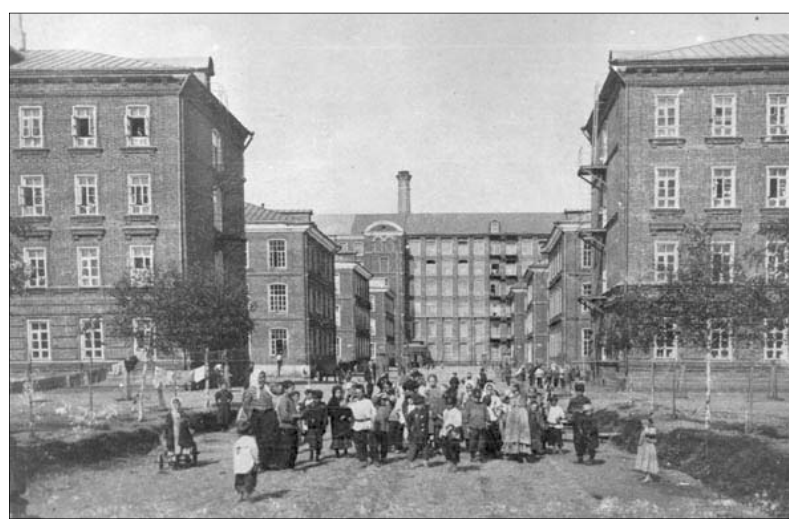
Рабочие возвращаются домой после смены. 1905 год.

Жители поселка Красный Перекоп дольше всех держались: еще два-три поколения назад они о себе говорили «перекопцы», а не «ярославцы». Но