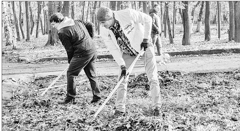
Участники субботника собрали и вывезли 448 кубометров мусора.

Традиционный осенний общегородской субботник прошел 21 октября во всех районах Ярославля.