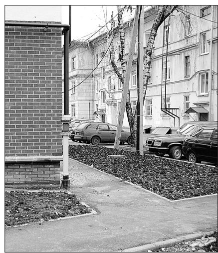
Территорию у нового дома на Республиканской необходимо благоустроить.

Дома, которые скоро введут в эксплуатацию, инспектирует комиссия.