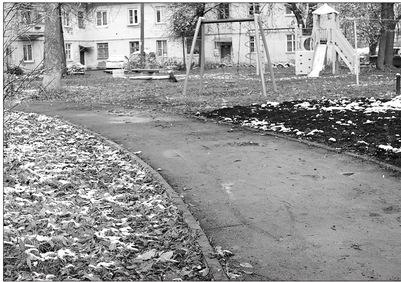
Во дворе на улице Жукова следов раскопок уже нет.